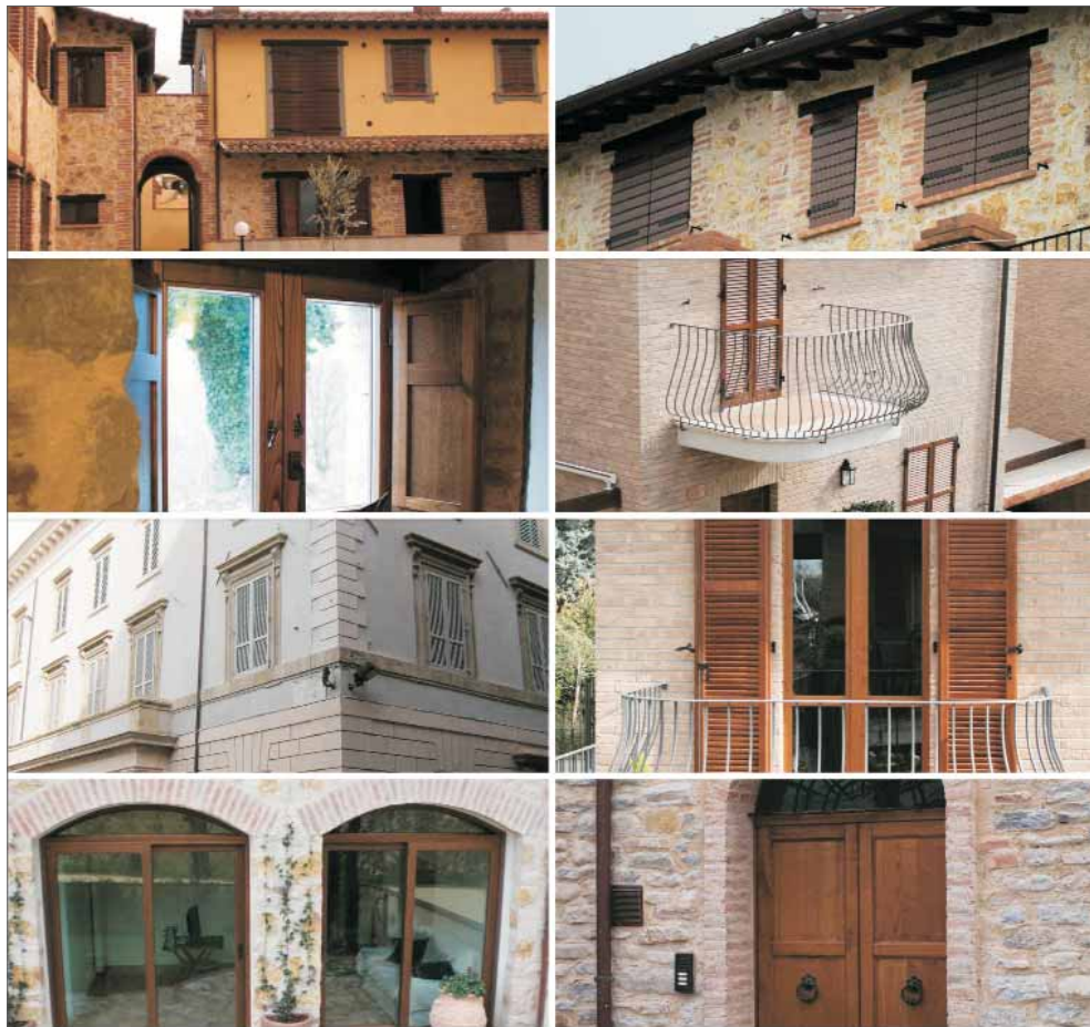
INFISSI DI MONTEFALCO