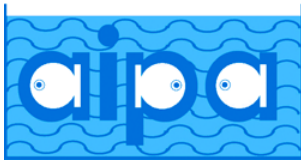
A.I.P.A. – Associazione Italiana Pesci ed Acquari