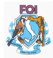
Federazione Ornicoltori Italiani ONLUS